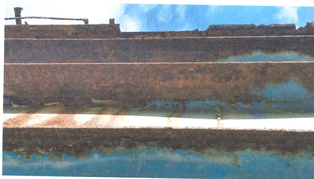
Barras de reforço externas danificadas devido a corrosão