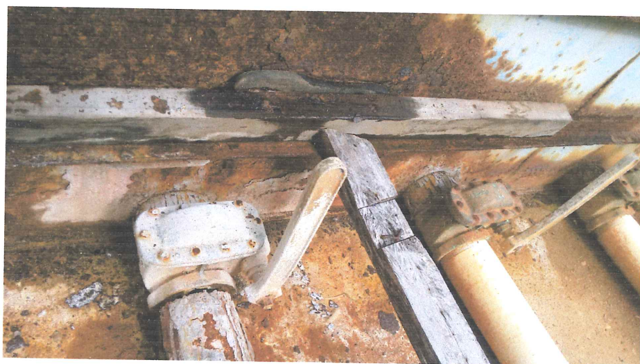
Costado apresentando corrosão acentuada e vazamento