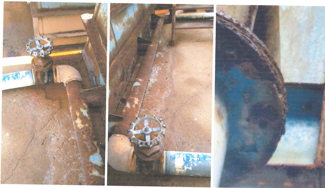
Corrosão na tubulação e flanges