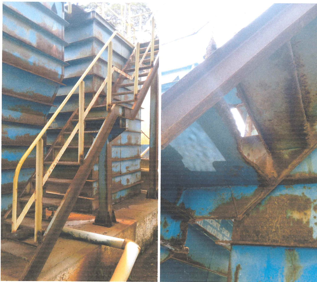
Corrosão nos degraus da escada e na fixação do corrimão