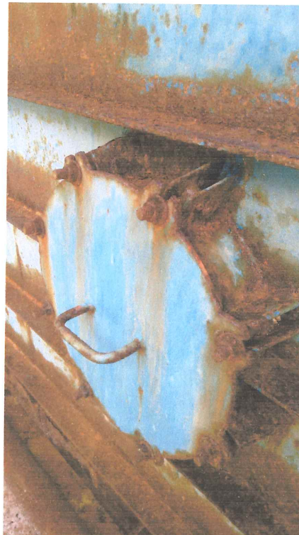
Parafusos emperrados na Boca de Visita