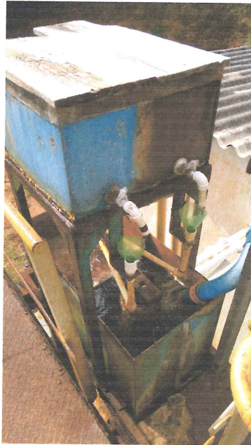
Caixa distribuidora superior com vazamento