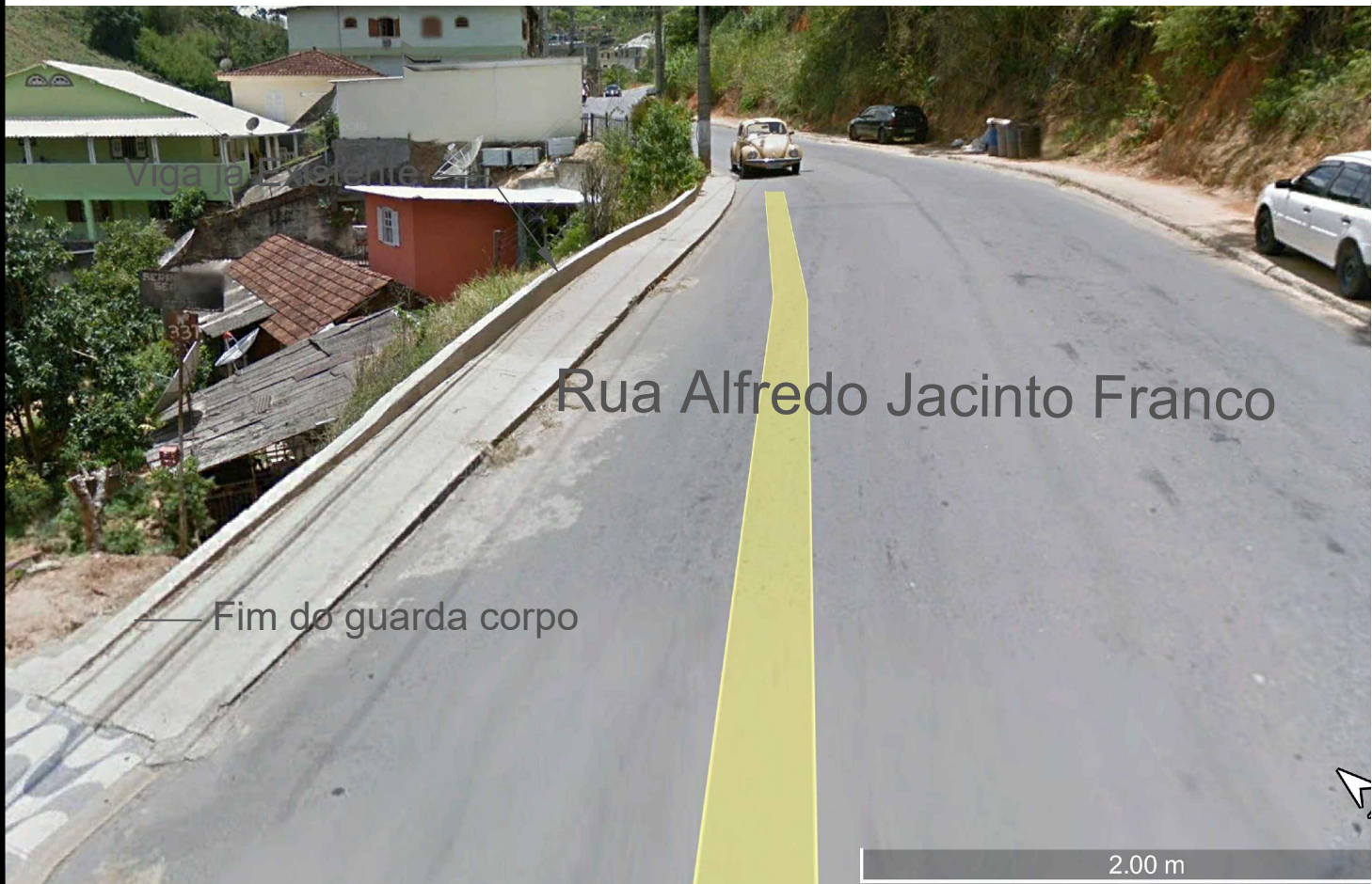
1 DETALHES Esc: 1:50