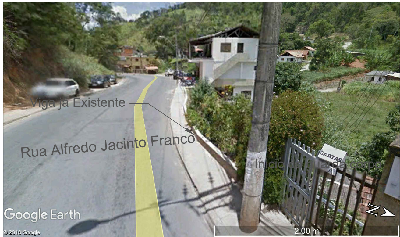
2 DETALHES Esc: 1:25