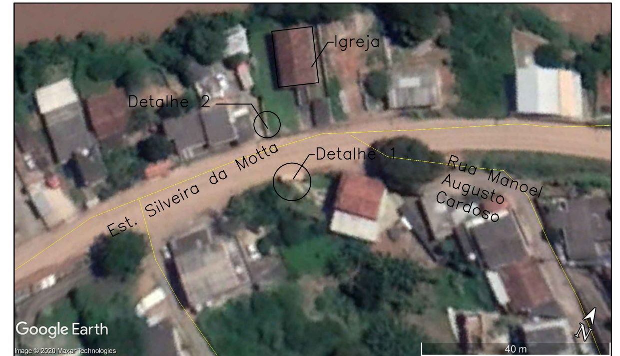
1 PLANTA DE LOCALIZAÇÃO Sem escala